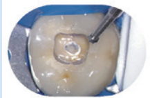
カーバイドバーラウンド25mmFG

カーバイドバーラウンド25mmFGを使用。ロングシャンクの為、タービンヘッドが隣在歯に接触しにくく、また術野が、大きく取れます。