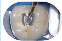
カーバイドパトランスメタルFG

カーバイドパトランスメタルFGを使用。切削効率に優れたメタル除去専用バーの為、メタル除去の時間を短縮できます。