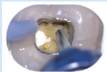
エンドゼックリヤ (アクセスZセット)