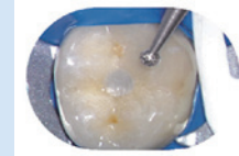
ダイヤモンドバーラウンドFG

ダイヤモンドバーラウンドFGを使用。高品質なバーの為、振動が少なく、歯質への負荷を軽減します。