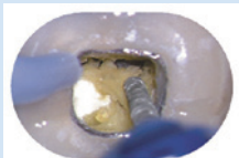
ダイヤモンドバーコニカルFG (アクセスセット)

ダイヤモンドバーコニカルFG使用。高品質なバーの為、振動が少なく、歯質への負荷を軽減します。