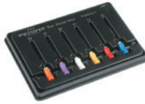
メルファープロテーパー メルファープロテーパー ハンドタイプ