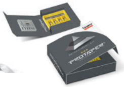
多様なラインナップ