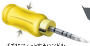
手指にフィットするハンドル