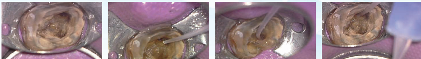
(図6) TruNatomy洗浄針を用いて根管内の浸出液を吸引している。各根管の湾曲や太さに対応して使用できる。