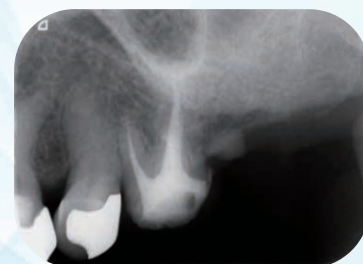
(図5) 再根管治療を行った#26の治療前と治療後のエックス線写真。TruNatomy洗浄針を用いて根管洗浄ならびに吸引を行った。