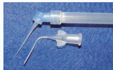
(図4) TruNatomy洗浄針を各種シリンジ、吸引装置に装着し有効利用が可能

図2にパイロゾイ針とTruNatomy洗浄針を示した。一目瞭然に長さ太さに違いがある。パイロゾイ針は23GであるのでISO規格から外径は約0.6mmである。また長さは曲がった部分から先端までが15mmである。これに対し、図3に示したようにTruNatomyは先端が30Gであり外径は約0.3mmである。長さも27mmと長く18、19、20、22mm部に線が入っていてわかりやすくなっている。本体がポリプロピレンでできているため、柔軟性に富み、湾曲した根管に追従することが出来る。また、根尖孔が破壊されているような患歯に使用しても、金属製ではないので組織を損傷しないで済む。パイロゾイ針は金属製であり、根管内に使用した場合、テーパーロックを起し、根管内から引き抜けない状況になることがあるが、TruNatomy洗浄針ではこの現象は起こらない。