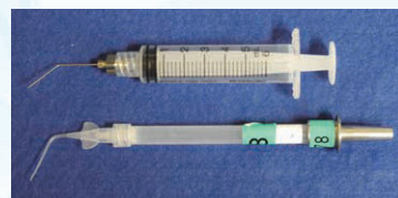
(図1) 当院で使用している根管洗浄用シリンジと洗浄針

現在までに根管洗浄を適確に行うべく様々な研究がされてきた。最近では超音波や吸引式などを応用したものが出てきているが、一般的には注射筒に洗浄針を装着して使用している臨床医が多いと思う。図1に当病院で使用されている根管洗浄用シリンジと洗浄針、根管内吸引用チップを示した。通常使用されている洗浄針はパイロゾイ針23Gではないだろうか。パイロゾイ針は先端に穴がありそこから洗浄液が放出される。古くはGoldmanら 1) が、根管内の水流の改良をするために、横穴を付けた洗浄針を開発し、その後様々なメーカーが様々なタイプの洗浄針を提供している。