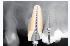
④ P:プロテーパーリトリートメントD3にて、根尖部-2mmまで、既根充材を除去