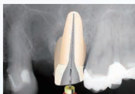
⑥ P:手用ファイルにて、根尖部の既根充材を除去し、その後、X3-X4-X5を使用し、最終的に、センシアスフレクソファイルにて#80まで根管形成した