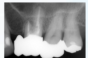
⑧ P, MB1, MB2:根尖部の拡大号数が大きく、根尖歯周組織の病変が認められ、根管内に湿潤傾向があったため、プロルートMTAにて根管充填 D:根尖歯周組織に異常所見は認められないため、ガッタパーチャポイント、AH プラスを使用して充填