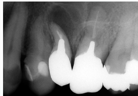
① 術前⑤(⑤は保存不可能だったため抜歯)