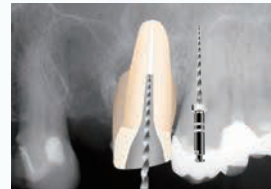
③ P:プロテーパーリトリートメントD2にて、根管中央部の既根充材を除去