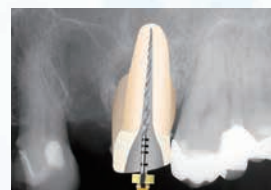
⑦ 近心根管(MB1とMB2):センシアスフレクソファイル#60 遠心根管(D):プロテーパーネクストX5(#50)