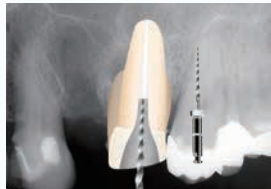
② ① 蓋根管(P):プロテーパーリトリートメントD1にて、根管上部の既根充材を除去