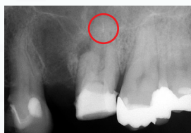
⑤ P:根尖部に既根充材が残存している