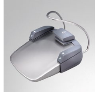
Funkfußschalter Smart Control