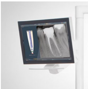
Monitor, 22", an der Leuchtaufbaustange