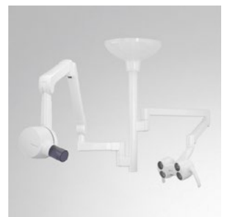
Deckenkombination mit Heliodent Plus