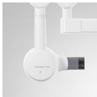
Heliodent Plus Gerätemodell