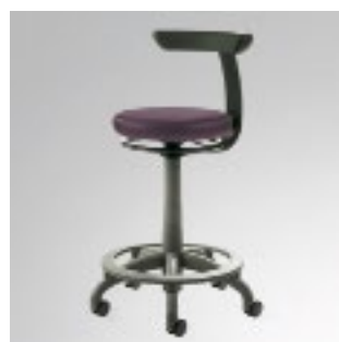
Carl (Manual Plus)