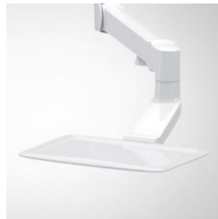
Tray am höhenverstellbarem Tragarm