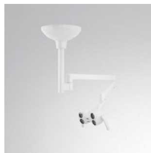
LEDview Plus Deckenmodell