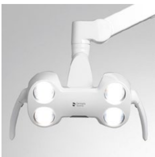
LEDview Plus Gerätemodell