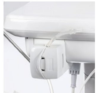
Pumpe für Kochsalzlösung