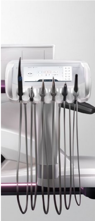
Axano mit motorischer Verschiebebahn