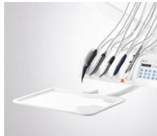
Zusatztray für 2 Normtrays