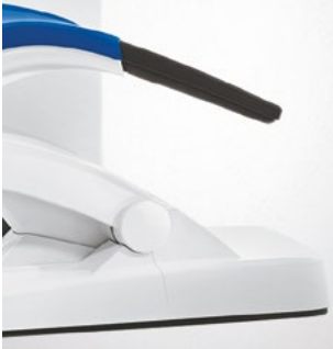
Intego Pro CS mit Schwingbügel