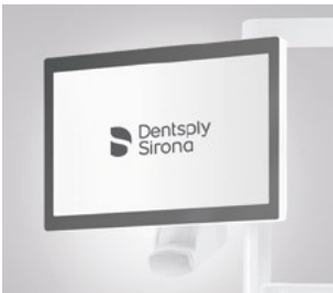
Monitor, 22", an der Leuchtenaufbaustange