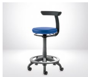
Carl (Manual Plus)