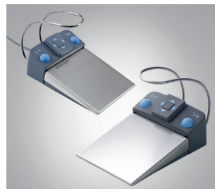
Fußschalter C+ Kabelversion / Funkfußschalter C+