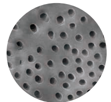
Treated with SmartLite Pro EndoActivator